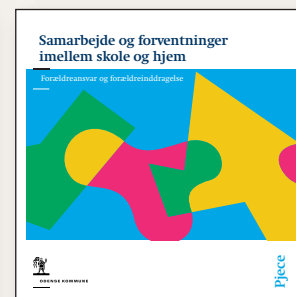
Hæfte og pjeces